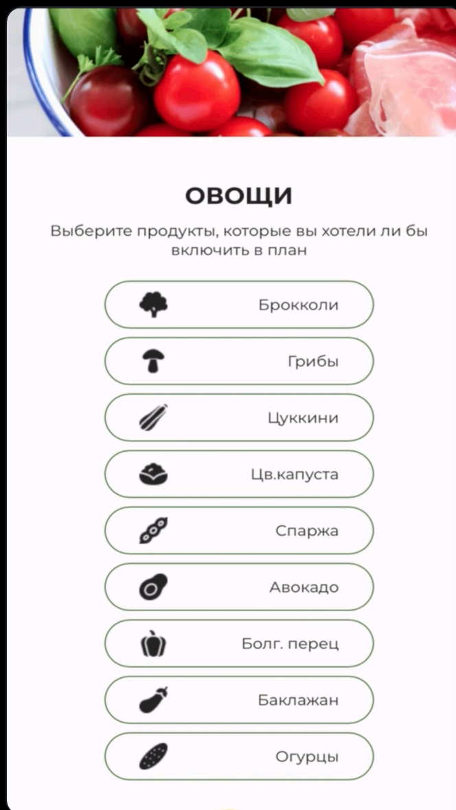
Лендинг Keto: квиз с выбором продуктов