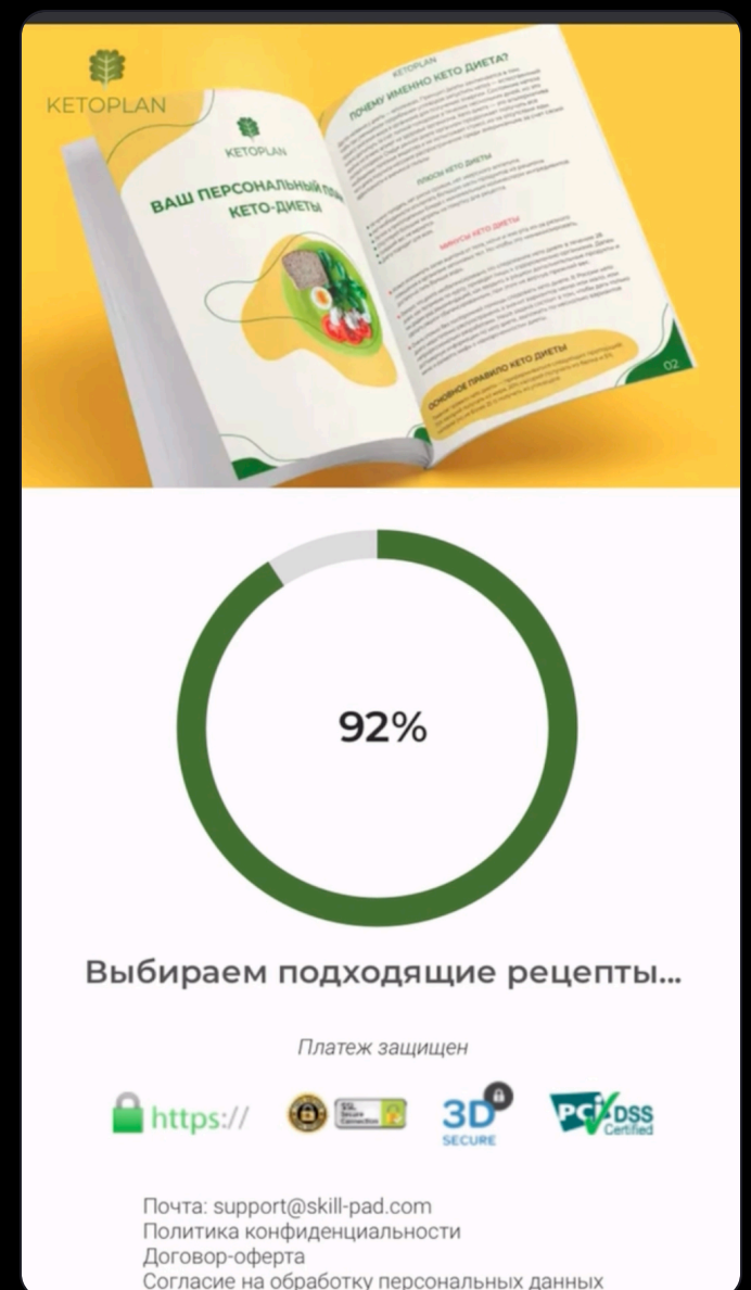
Лендинг: персональный план + оплата